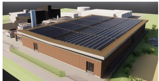
Abbildung: Bestehende ARA im Vergleich zum Ausbau-Projekt (Visualisierung HBT)